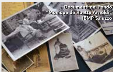
Documenti del Fondo "Monique de Ruette Arnoldi" IBMP Saluzzo